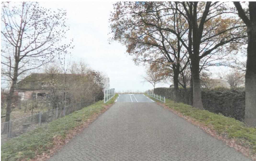
Foto 1: Begin van Vijfhoevenlaan vanuit Randweg met ingetekende geluidschermen

Onderstaande foto's geven een beeld van de Vijfhoevenlaan.