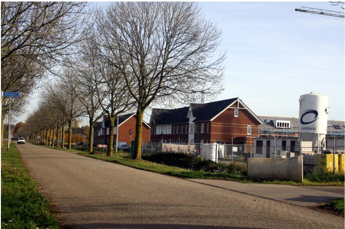
Foto 3: In aanbouw deel Grassen aan Vijfhoevenlaan